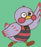
埼玉県のマスコット 「さいたまっちゃん」

【主催】埼玉県 【共催】埼玉県産業文化センター 【後援】埼玉県商工会議所連合会・埼玉県商工会連合会・埼玉県中小企業団体中央会 埼玉県経営者協会・埼玉経済同友会・埼玉中小企業家同友会・埼玉県産業振興公社 【女性活躍推進業務受託者】埼玉新聞社